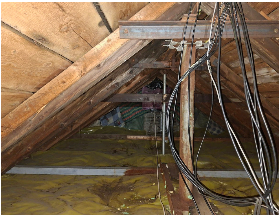
Obrázek 5: půdní prostor objektu.