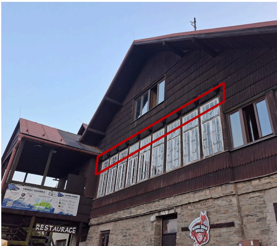
Obrázek 4: pohled z východní strany, červeně označené jsou potenciálně vhodné štěrbiny mezi obložením a stěnou.