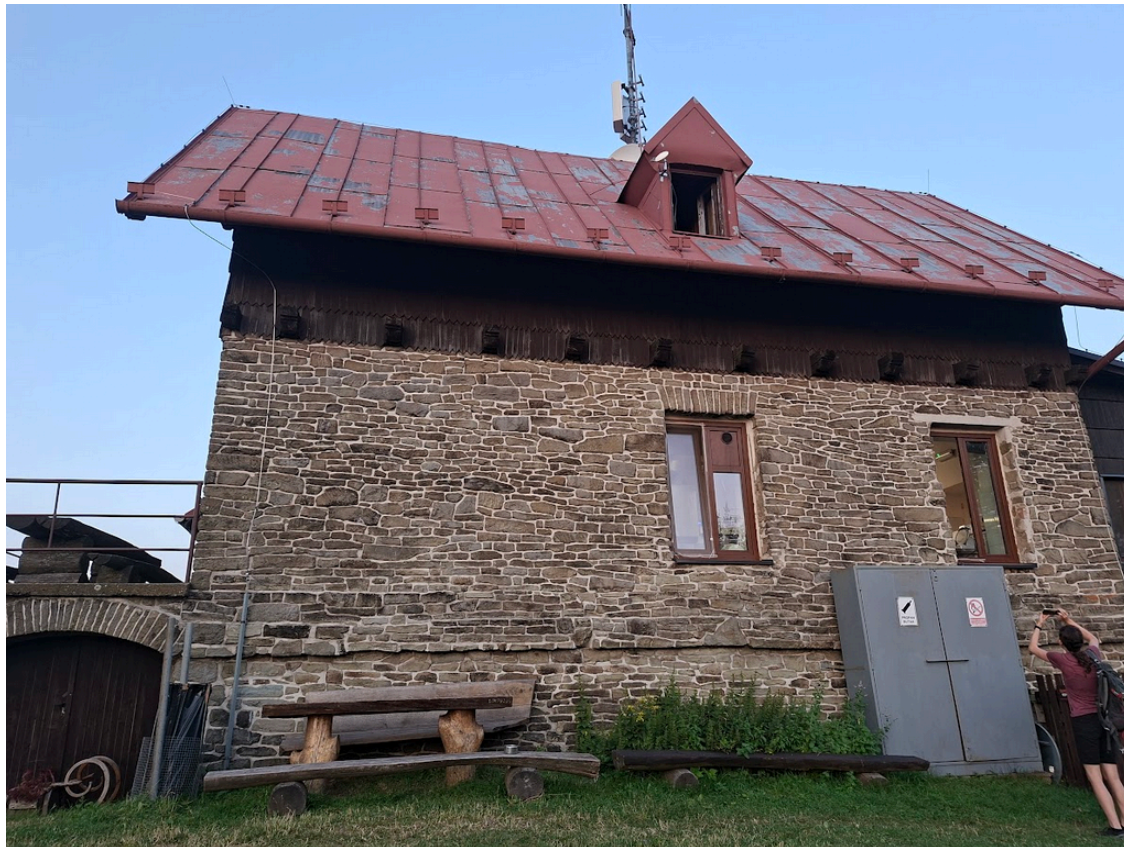
Obrázek 1: pohled ze západní strany.