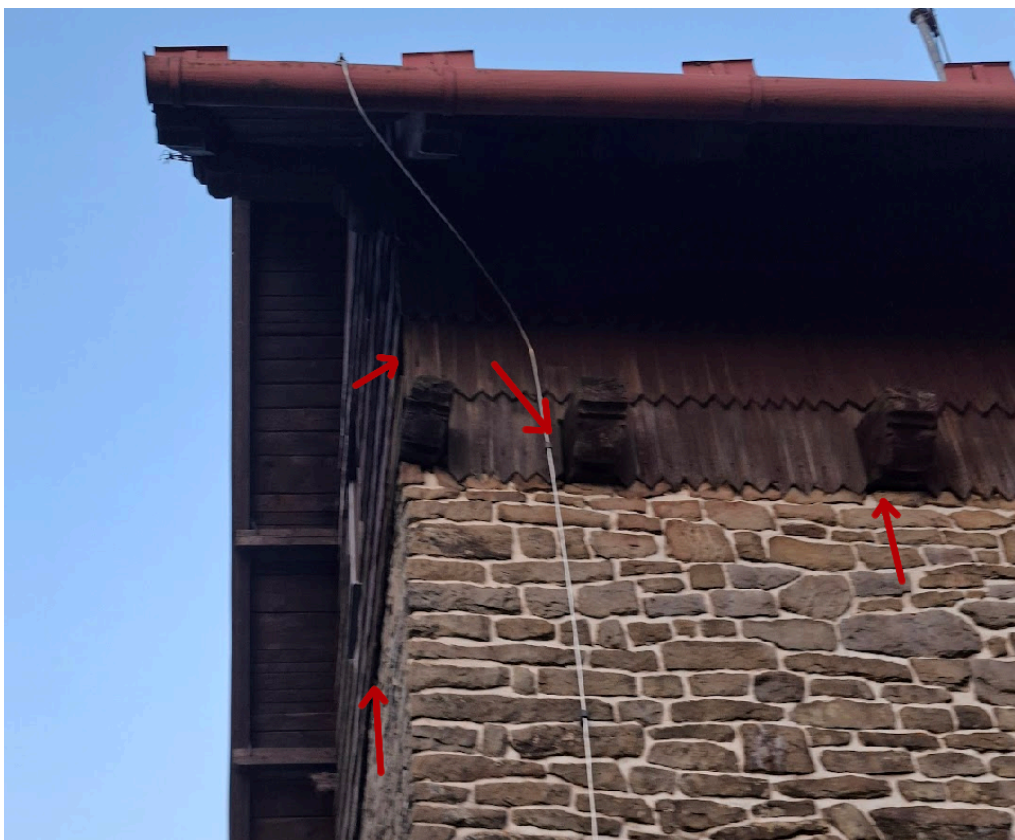
Obrázek 2: detail pohledu ze západní strany. Příklad potenciálně vhodných vletových otvorů pro malé, šterbinové druhy netopýrů.