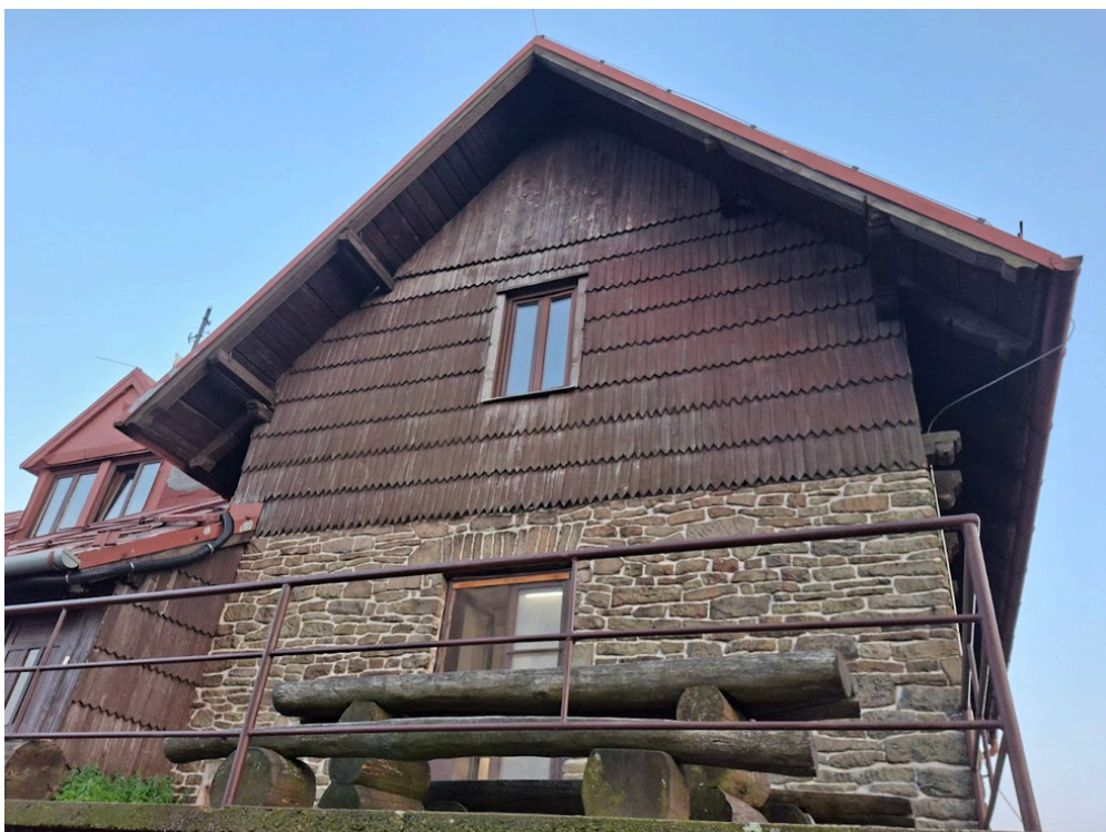
Obrázek 3: pohled ze severní strany.