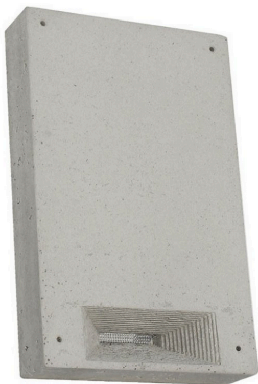
Obrázek 7: příklad dřevocementové budky Schwegler 1W1.